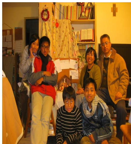
幸福喜樂寫在每一個家人的臉上