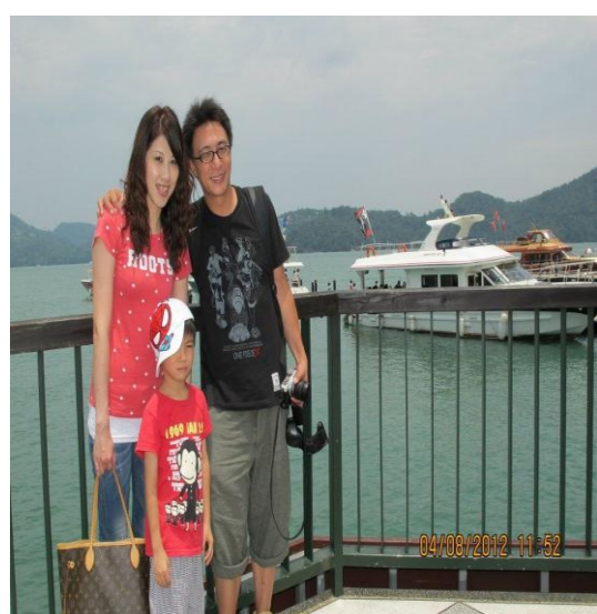
爸爸說：到日月潭來不要耍酷，別人以為你在哭！