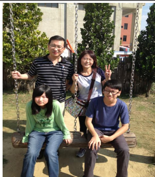
幸福就是 ~ 全家福 ~