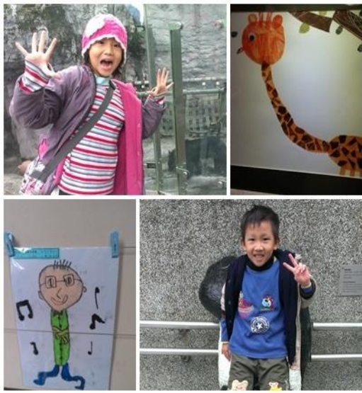
看！文蘭媽媽家的溫柔姐與搞笑弟 ~ ◡ ◡ ~