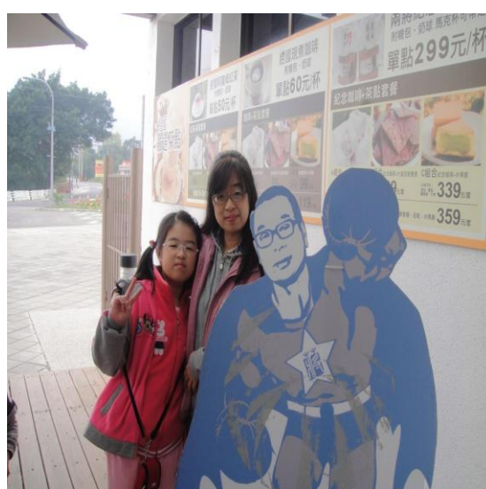
我的爸爸就像超人一樣強壯，保護我們全家。