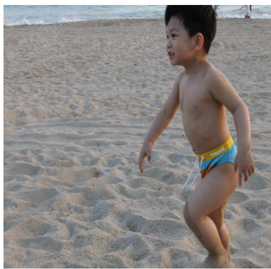
知道我是誰嗎？我是冠蓉媽媽家的小帥哥~