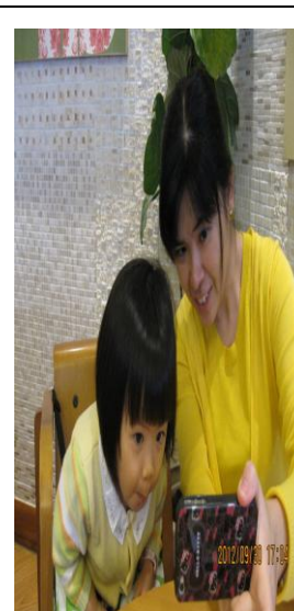
哇~我的眼睛這麼大了~~