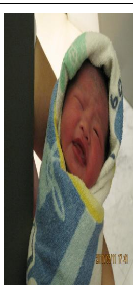
剛出生眼睛都還沒張開呢~