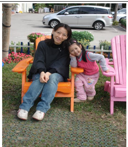
明年，我就是「小姊姊」囉！